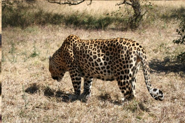
Een luipaard in de kracht van zijn leven

Een luipaard kom je niet vaak tegen overdag. Hij is een meester in verstoppertje spelen. Overdag verbergt hij zich in struikgewas of in bomen. Prooi, soms groter dan zichzelf, brengen ze meestal in de bomen veilig tegen vijanden zoals leeuwen en hyena's.