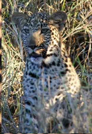
Jong maar niet bang op de uitkijk