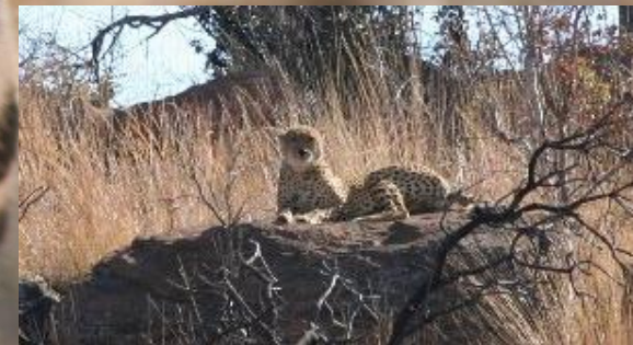
Cheeta op de uitkijk

Sommige cheeta's hebben een foutje in hun genen waardoor hun vlekken groter zijn. Ook hebben ze dikke strepen op hun rug. Deze cheeta's worden koningscheeta genoemd