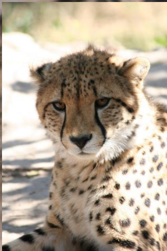
Kenmerkende zwarte strepen rond de neus

Het jachtluipaard leeft en jaagt alleen. Ze worden gemiddeld 12 jaar oud. Door zijn lage gewicht: 21-72 kg is hij geen partij voor leeuwen en andere grote roofdieren.