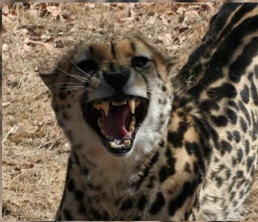
Ook de deze kat heeft beste tanden

Cheeta's zijn niet geliefd bij boeren, omdat ze klein vee ook als prooi zien. In Zuid-Afrika gaan ze met getrainde dieren langs scholen voor voorlichting. De cheeta is bedreigd in het wild.