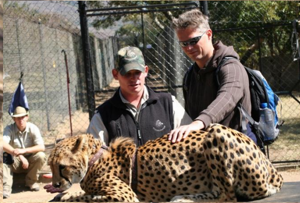
Cheeta voorlichting met aaimoment

Cheeta's zijn niet geliefd bij boeren, omdat ze klein vee ook als prooi zien. In Zuid-Afrika gaan ze met getrainde dieren langs scholen voor voorlichting. De cheeta is bedreigd in het wild.