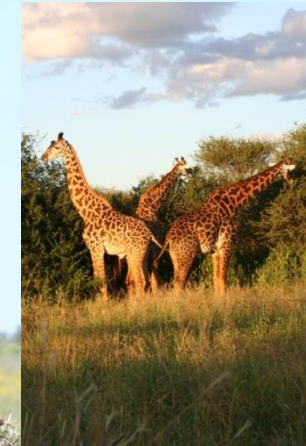
Giraffes etend aan het einde van de dag

De giraffe is het hoogste dier ter wereld. Een jong is bij geboorte al gauw 2 meter en een volwassen dier kan groter dan 5m worden.