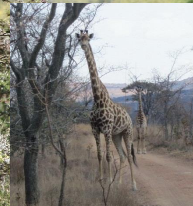
Moeder en jong langs de kant van de weg

Een giraffe eet vooral bladeren en schors, het lieft van de acacia en mimosa. Een giraffe wordt tussen de 15 en 25 jaar oud. Hij weegt wel tot 1900 kg.